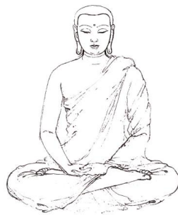
จบ อุเบกขาภาวนา

ทั้งสองอย่างนี้แม้ว่าจะมีการวางเฉยต่อสัตว์ด้วยกันก็จริง แต่อารมณ์ที่จะให้เกิดความวางเฉยนี้ต่างกัน คือ อุเบกขาอัปมัญญา มีการวางเฉยต่อสัตว์ คือ ละความวุ่นวายที่เนื่องด้วย เมตตา กรุณา มุทิตา มีสภาพเข้าถึงความเป็นกลางในสัตว์ทั้งหลาย แต่ อุเบกขาบารมี นั้น เป็นการวางเฉยในบุคคลที่กระทำดีและไม่ดีต่อตน โดยไม่มีการยินดียินร้ายแต่ประการใด คือ ผู้ที่กระทำความดี มีความเคารพนับถือ บูชา สักการะ เกื้อกูล อนุเคราะห์ สงเคราะห์ เป็นประโยชน์แก่ตนสักเท่าใด ก็คงมีจิตวางเฉยได้ และไม่ว่าผู้ใดจะทำไม่ดี มีการประทุษร้ายต่อตนสักเพียงใดก็ตาม ก็คงวางเฉยอยู่ได้เช่นกัน ในการวางเฉยทั้ง ๒ อย่างนี้ ฝ่ายบารมีประเสริฐยิ่ง การบำเพ็ญก็สำเร็จได้ยาก